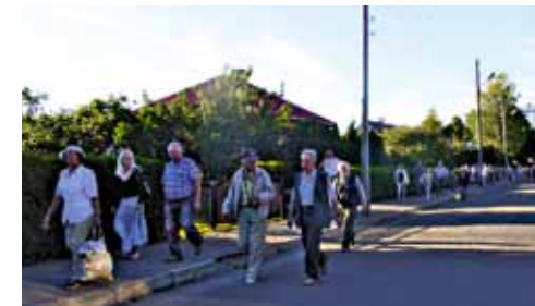
Mesinike protsessioon õhtuses Kuressaares.

Kokku saime jälle ööbimiskohas, milleks oli Saaremaa