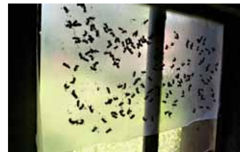
Liimipaberist herilasepüünis akna ees.