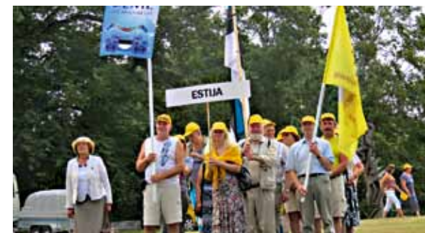
Meie delegatsioon Leedus.

kallal) just need, kellel endal on kas vähe reisikogemust või kes tahavadki teiste tegemisi vaid negatiivses valguses näha. Tore on aga tõdeda, et üldjuhul on EMLi "reisilised" väga tolerant- sed, koostöövalmid ja üksteise suhtes hoolivad. Jah tõesti, välja on kujunenud tuumik, kes käib meiega võimaluse korral aasta jooksul rohkem kui ühel reisi- sil. Aga kas seda saab pahaks panna, kui inimesed investeerivad oma teadmiste ja meeldivate emotsioonide kogemistesse,