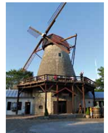
Veski trahter.