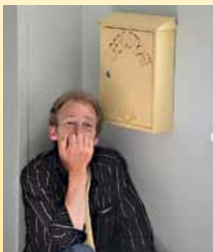
Püütud hetk Kuressaare teabepäevalt.