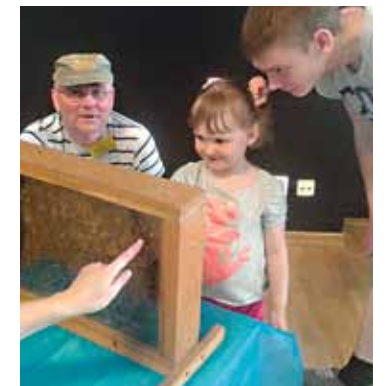
Botaanikaaias mesindust propageerimas.

Ja siis... taas üllatus. Peakorje lõppes, mida oligi oodata, sest põdrakanepi õitsemise viimane faas näitas selgelt, et saagiaasta on sisuliselt läbi. Ootamatult lõppenud korje tekitas mesilastes aktiivse vargustungi, ja mesilasperede koondamine on hetkel tõsiseks probleemiks. Lisaks herilaste invasioon, kes lausa roheliste mehikeste kombel võõrale maale tungivad! Talvituma läheb vähemalt 40 mesilasperet, aga on tõenäoline, et nii mõnigi nõrgem mesilaspere annekteeritakse. Olen sanktsioonidega osaliselt