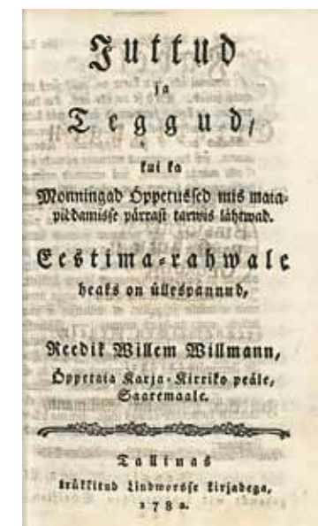
F.W.v. Willmanni raamat "Juttud ja Teggud..."

1819) välja raamatu "Juttud ja Teggud kui ka Monningad õppetused mis maiapidamisse pärrast tarwis lähtwad", kus üks peatükk on pühendatud mesindusele. Selle peatüki pealkirjas seisab "Õppetus kuidas keik ma rahvas woib, ilma sure waewata, linnopuud piddada ja se läbbi rikkaks saada". Raamat oli väga populaarne, sest sisaldas ka muid põllumajanduslikke nõuandeid, mistõttu sellest anti 1787., 1808., ja 1838. aastal