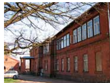
Viljandi Eesti Põllumeeste Seltsi kunagine hoone

noomituse alla ja ütles neile: “Teie, Juuru kihelkonna koolmeistrid, tahate siin ühte niisugust seltsi asutada, mis ei kõlba mitte teha. See põllumeeste selts on kui üks suur hall mantel, kuhu alla poete ja seal kurja nõu peate. Mina aga ütlen teile, Juuru koolmeistrid, kui teie tahate selles seltsis edaspidigi töötada, siis andke koolmeistri amet oma vendade kätte!”