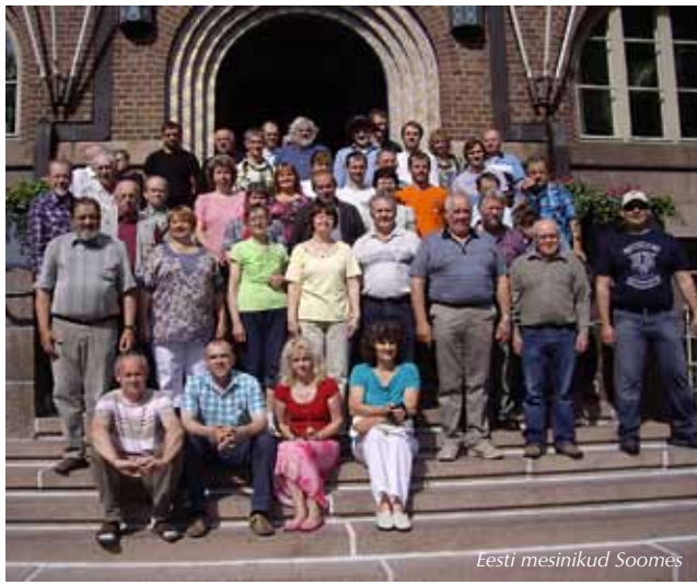
Eesti mesinikud Soomes

EML koostöös Turba Aianduse- ja Mesinduse Seltsiga kirjutas projekti ning nüüd sõidetakse 48