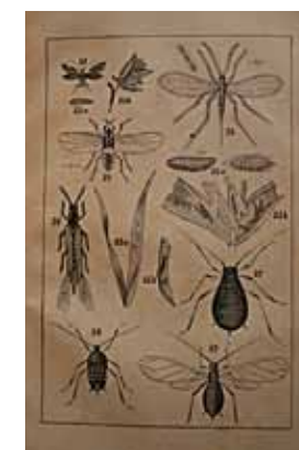
A.M. Butlerovi “Käsiraamat. Kuidas mesilasi pidada”