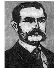
Francesco de Hruschka

Ka Eesti mesinduses hakkasid puhuma uued tuuled 18. sajandi lõpupoole, mil looduses hakkas nappima pakktarudeks sobilikke puutüvesid, mistõttu soovitati tarusid valmistada laudadest "nellikantlikkud".