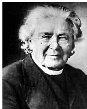
Lorenzo Lorrain Langstroth

mesilased ei täida taruvaiguga, ega ehita sinna ka kärge. Käigu suurus varieerub 5–9 millimeetri vahel. Üldreeglina on peaaegu kõik tarude konstrueerijad võtnud aluseks mesilaskäigu keskmise suuruse – 7 mm. Kui näiteks taru pesaruumi sein ja raami otsaliistu vahe on suurem kui 9 mm, siis ehitavad mesilased sinna kärje, aga kui see vahe on väiksem kui 5 mm, siis täidavad mesilased selle avause taruvaiguga. Seega oli Langstrothi avastus mesindusmaailmas epohhiloov ja teda tuleks pidada tõeliseks raamtaru leiutajaks, sest tema avastus võimaldas vabalt liikuvate raamidega taru konstrueerimise. Seda põhimõtet on agaralt kasutanud väga paljude maade mesinikud ja tarude konstrueerijad, mille tulemusena maailmas tuntakse tänapäeval üle 600 erineva tarutüübi.